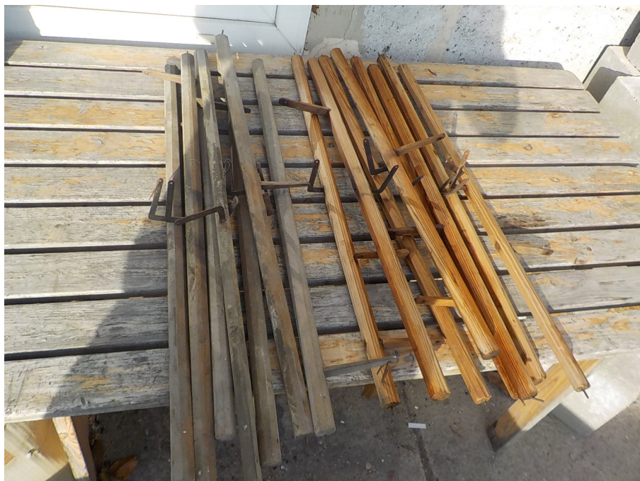
Wálki skrętné traktury podczas prac.