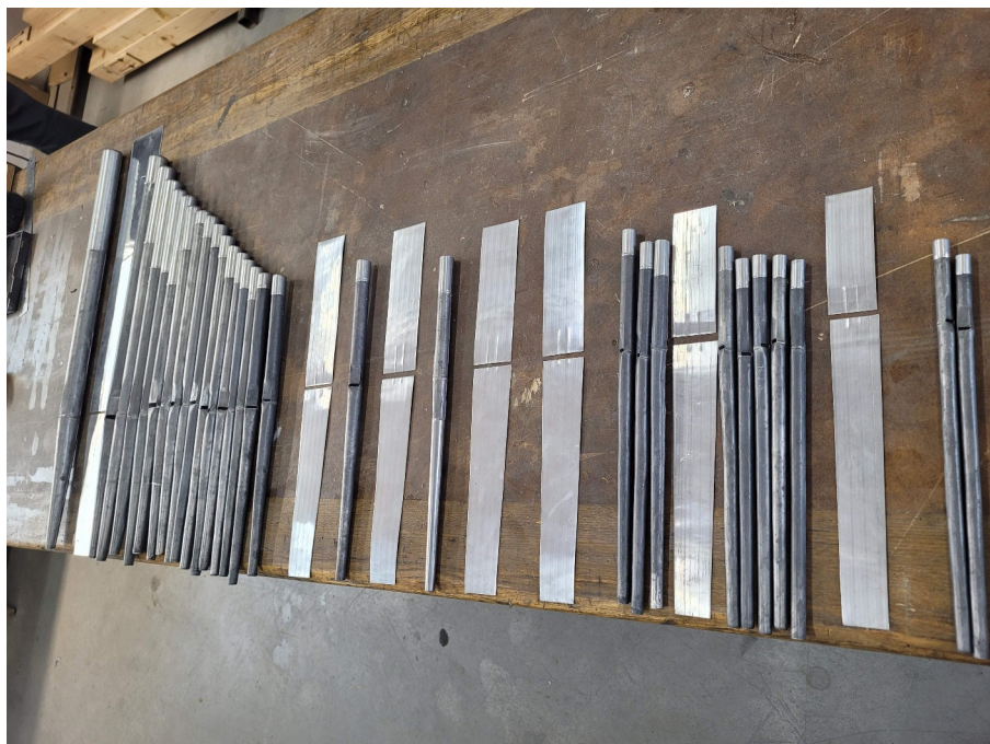
Płaty blachy na puszczalki naszykowane do zwijania.