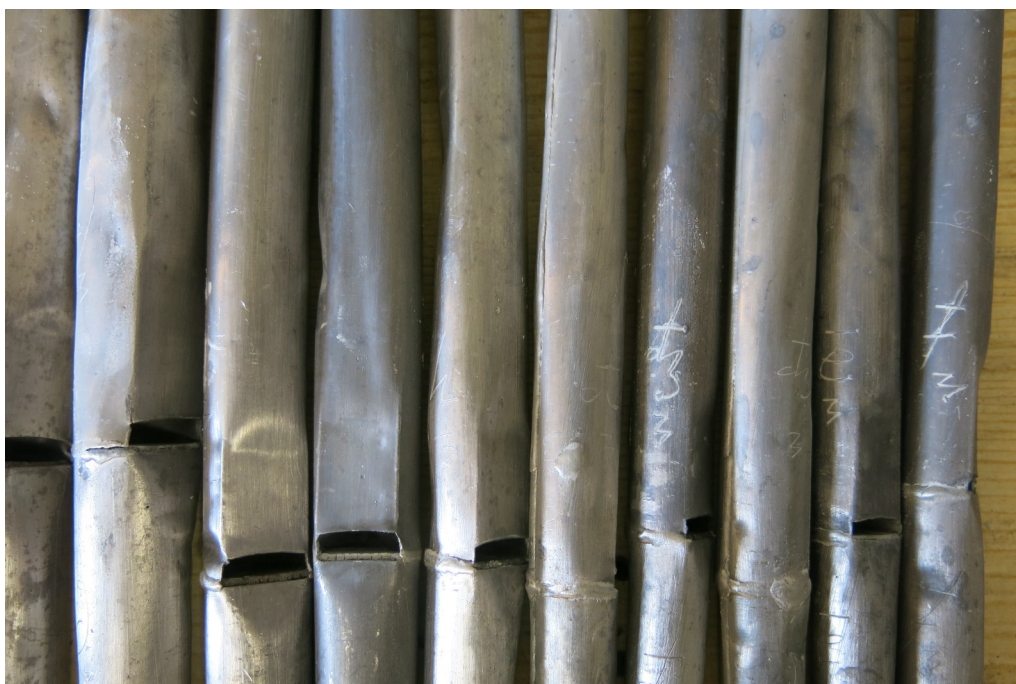
Sygnowanie puszczalek Quinte 3'