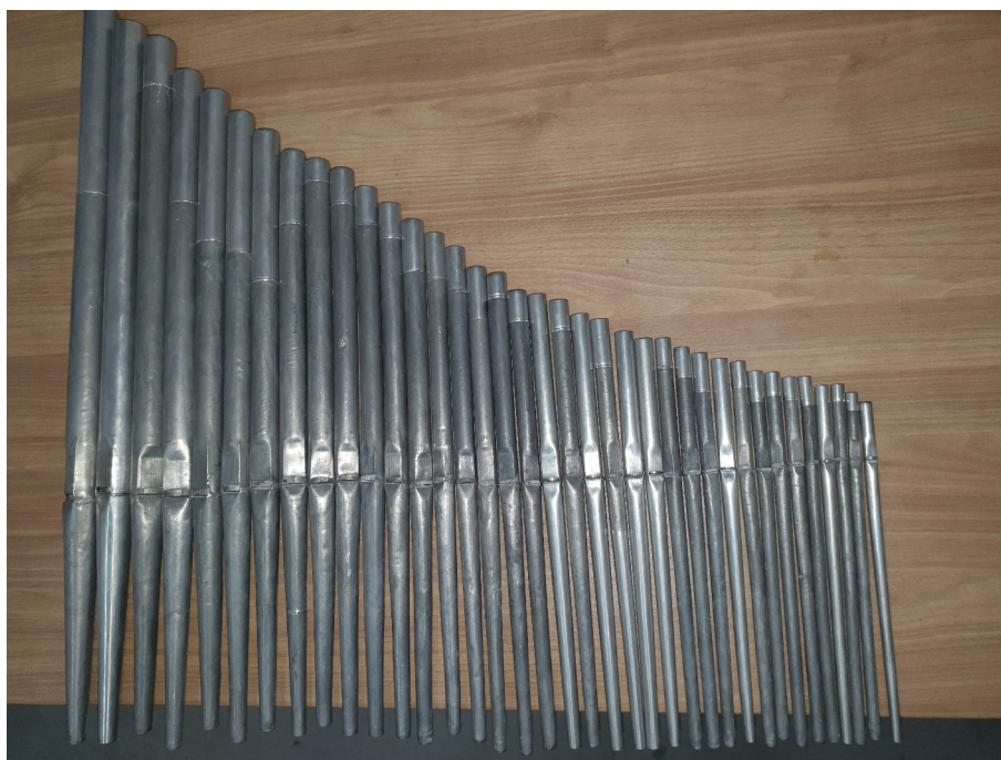
Głos po naprawach.