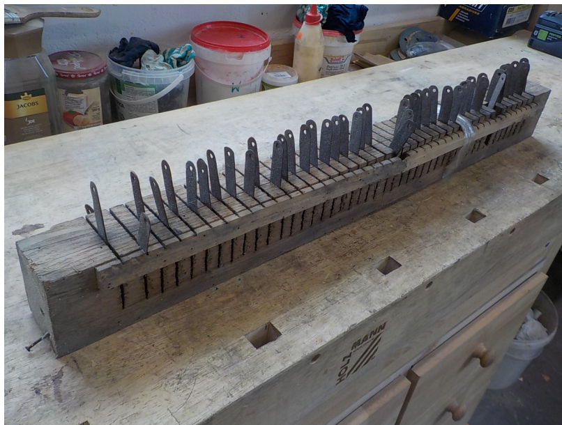
Belka wałków skrętnych.

Piszczalki głosu Quinte 3' – zostały oczyszczone i ułożone dźwiękami, na piszczałkach istnieje sygnowanie wykonane rylcem z cyfrą 3 co pozwoliło odróżnić je od innych piszczałek i nie pomieszać głosów. Wykonaliśmy wyliczenia menzuracyjne aby można było zrekonstruować brakujące piszczałki. Część piszczałek została obcięta podczas wcześniejszych „prac” i zaistniała konieczność przedłużenia korpusów w celu otrzymania odpowiedniego dźwięku. Wszystkie prace wykonaliśmy wykorzystując odpowiedni stop cyny i ołowiu.